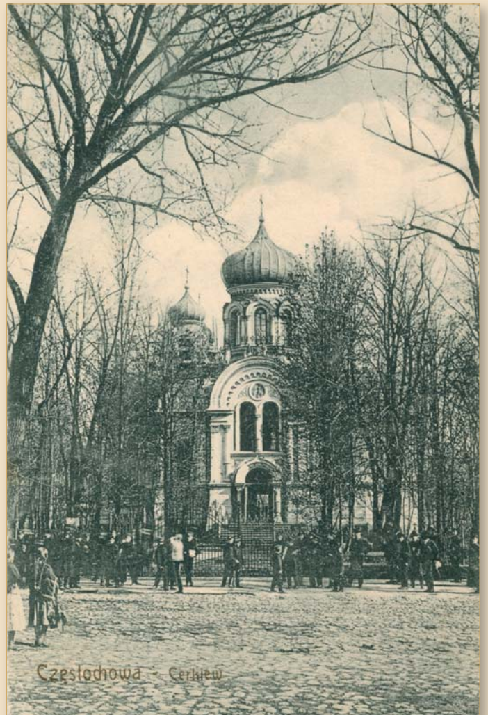
Częstochowa – cerkiew św. św. Cyryla i Metodego (obecnie kościół św. Jakuba), ok. 1910 r.