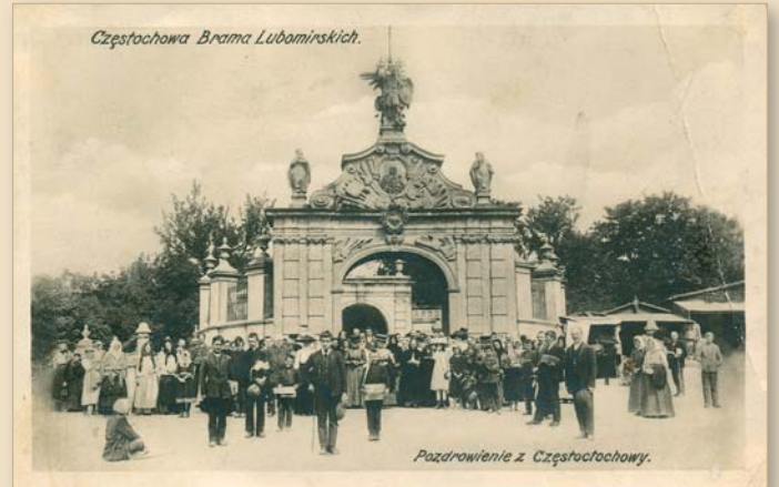
Jasna Góra – pielgrzymi przed Bramą Lubomirskich, ok. 1915 r.