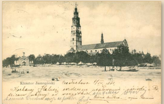
Jasna Góra ze starą wieżą, ok. 1900 r.