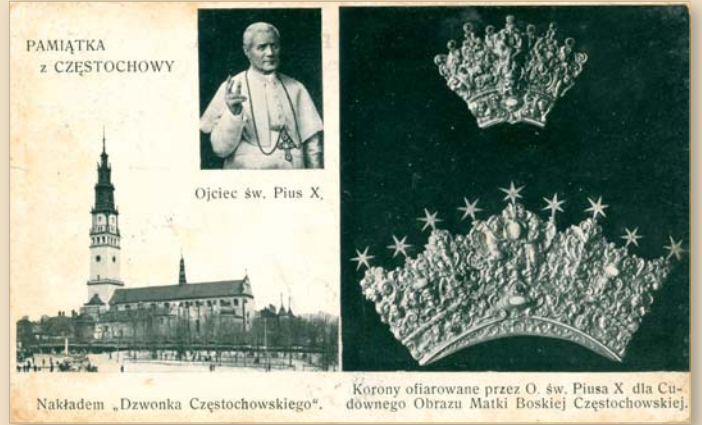
Korony ofiarowane przez Piusa X dla Cudownego Obrazu po kradzieży w 1909 r. poprzednich koron. Rekoronacja odbyła się 22 maja 1910 r.