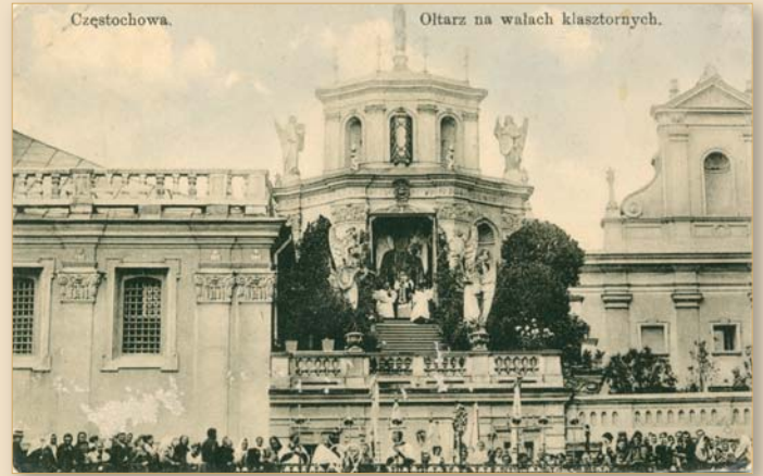
Ołtarz na Szczycie Jasnogórskim, ok. 1920 r.