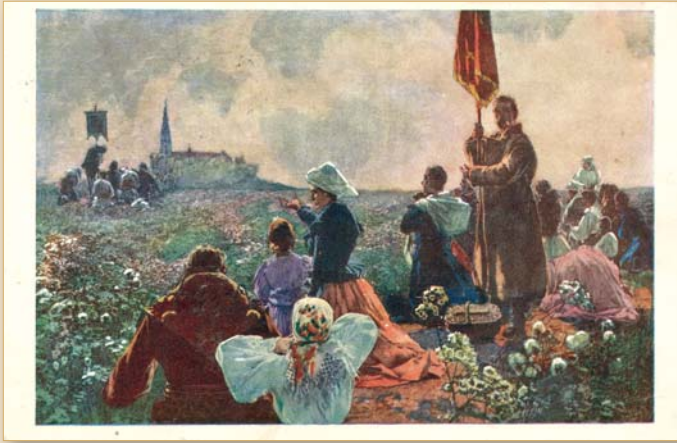
„Na Jasną Górę”, mal. L. Stasiak, ok. 1930 r.