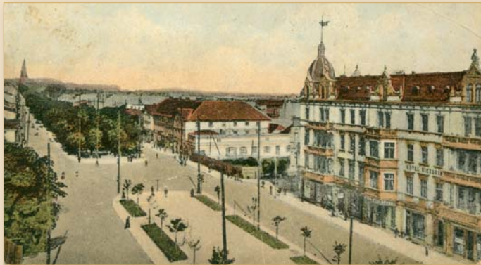
Częstochowa, I i II aleja Najświętszej Maryi Panny, ok. 1915 r.