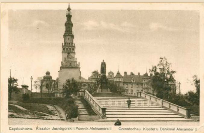
Pomnik cara Aleksandra II Romanowa na placu pod Szczytem, ok. 1910 r.