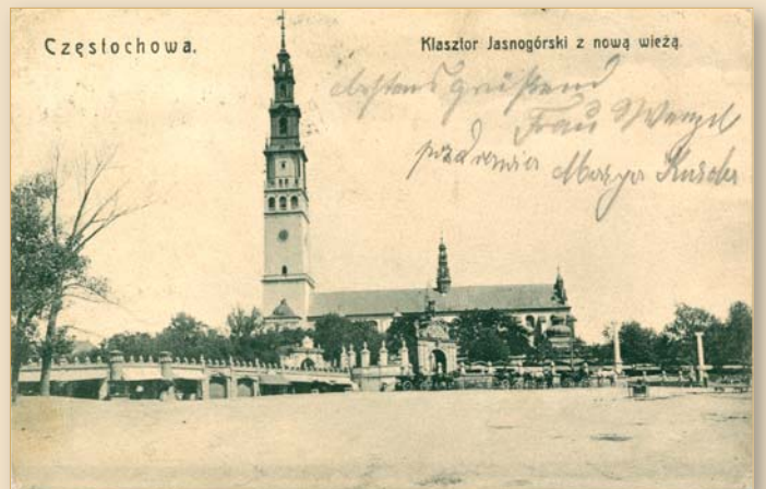
Jasna Góra z nową wieżą, ok. 1906 r.