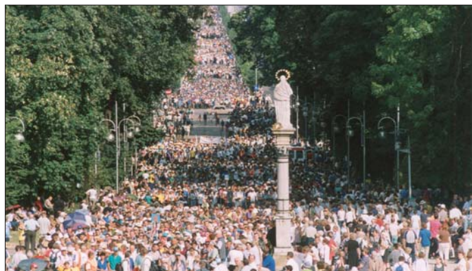
Widok z wieży jasnogórskiej na aleję Najświętszej Maryi Panny – VI Światowy Dzień Młodzieży, sierpień 1991 r.

Nazaret, Szawle na Litwie i Zapopan w Meksyku. W 1998 roku za działalność integracyjną na rzecz społeczności lokalnych miasto otrzymało nagrodę Rady Europy Prix de l'Europe. Doskonałym przykładem współpracy miasta i sanktuarium było też zorganizowanie w 1991 roku VI Światowego Dnia Młodzieży, kiedy to miasto musiało przyjąć prawie dwa miliony młodych ludzi z kilkudziesięciu krajów świata.