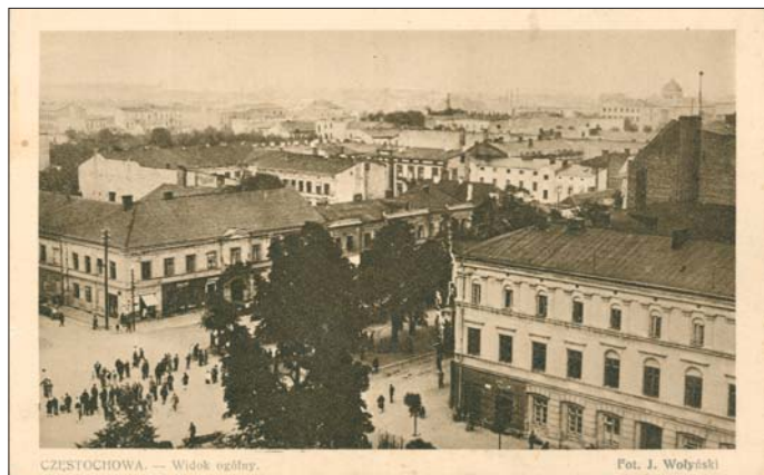
Widok na Częstochowę, ok. 1930 r.

położone w pobliżu Jasnej Góry domy zakonne. Nie najlepiej przedstawia się dostępność komunikacyjna miasta. Częstotliwość połączeń kolejowych z największymi miastami w Polsce jest mała. Wystarczy wspomnieć połączenie z Krakowem, a przecież wielu przybywających do grodu Kraka chętnie wybrałoby się również do Częstochowy. Dlatego w ruchu pielgrzymkowym coraz większą rolę