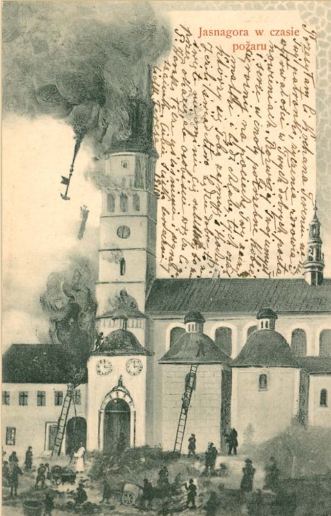
Pożar wieży jasnogórskiej 15 sierpnia 1900 r., ok. 1900 r.