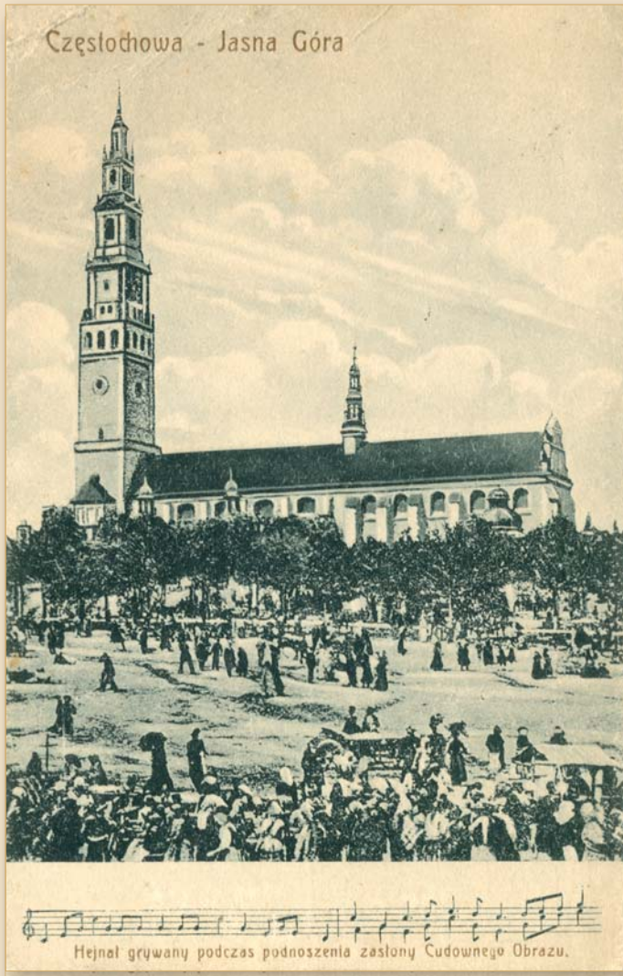
Widok Jasnej Góry z nutami hejnału wykonywanego podczas odsłonięcia Cudownego Obrazu, ok. 1910 r.