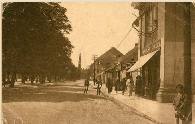
Częstochowa – III aleja Najświętszej Maryi Panny, ok. 1914 r.